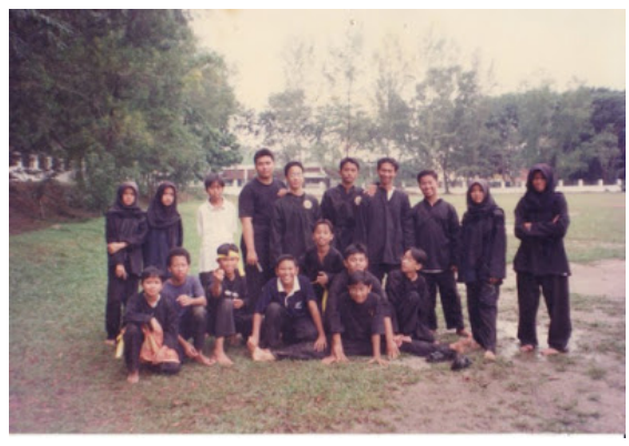
SMK BBB tahun 2000