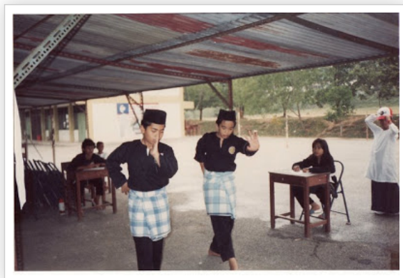
SRK BBB (Kini SK BBB) 1988