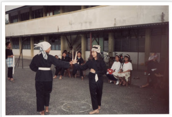
SRK BBB (Kini SKBBB) 1988