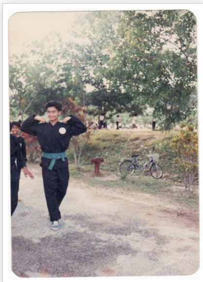
SRK BBB (Kini SKBBB) 1988