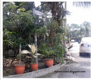
Jalan 1/2C yang terletak di Seksyen 1, Bandar Baru Bangi