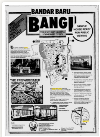
Perancangan pembangunan 'Bandar Universiti' oleh PKNS yang diklikan pada tahun 1963.