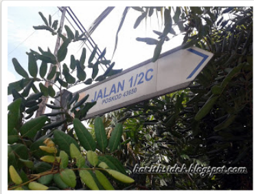
Tanda jalan 1/2C, kawasan perumahan terawal di Bandar Baru Bangi.

Perkara pertama yang beliau lakukan setelah berpindah ialah menaiki basikal disekitar kawasan kediamannya dengan harapan akan bertemu dengan penduduk lain, malangnya tidak seorang pun yang beliau temui. Suasana persekitaran yang pada ketika itu masih dipenuhi hutan belantara serta tanpa kemudahan elektrik menyebabkan beliau sangat gusar memikirkan keselamatan dirinya sekeluarga.