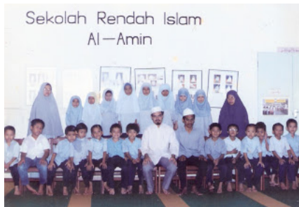
Antara 10 guru pertama & 41 pelajar pertama Al-Amin Serdang

1989..masjid jamek Serdang yang menjadi saksi kesungguhan, pengorbanan, dan permulaan perjalanan panjang survival Al-Amin Bangi di persada pendidikan