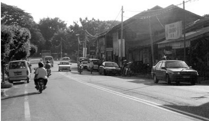
Pekan Sik 7 Jun 2002

Tahun 1968 ayah membawa saya, emak merantau ke Sungai Batang, Sik. Sebagai kanak-kanak lelaki baru berusia 10 tahun saya tidak mengerti apa-apa tentang kehidupan orang dewasa. Suka atau tidak, saya hanya akur dengan penghijrahan itu. Maka bermula tahun 1968 saya menjadi sebahagian penghuni sebuah kampung di pedalaman Kedah.