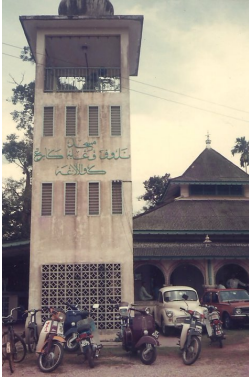
Masjid TPG circa 1970s