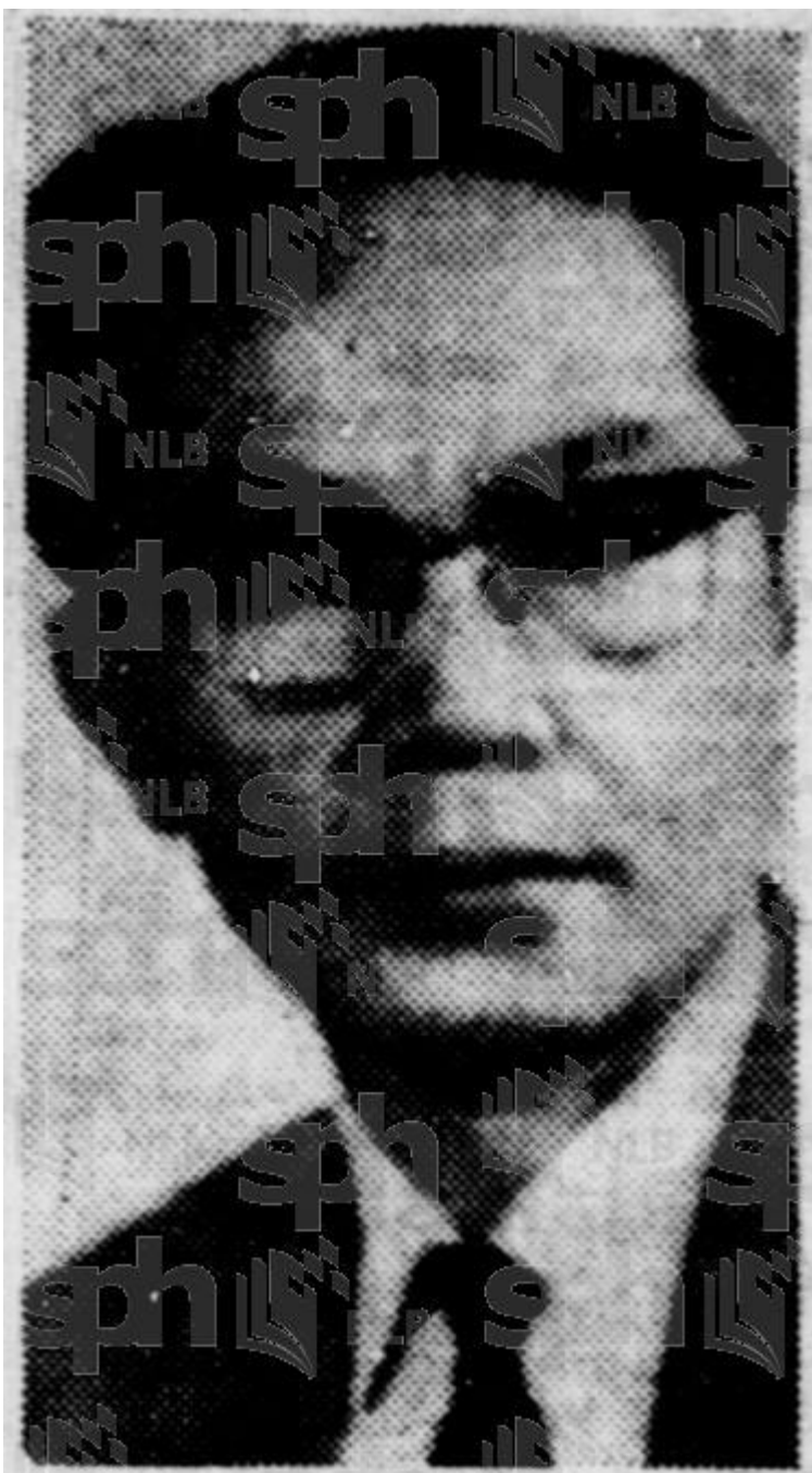
DATUK KAMPO RAJO