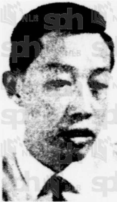
ENCHE HIJAS... menafikan penyakit Shukra kerana 'rauing.'

Orang ramai tidak dibenarkan melawat Shukra, bahkan ayah-nya sendiri terpaksa menunggu masa lawatan untuk melawat anak-nya itu.