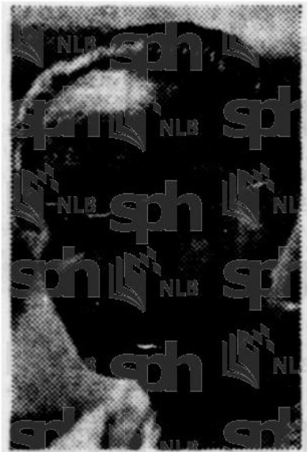
DATO KAMPO RADJO