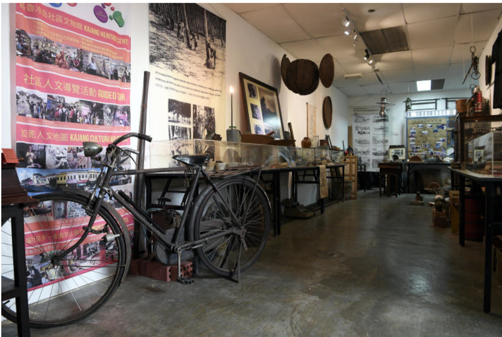
Antara artifak peninggalan sejarah penting Bandar Kajang di Pusat Warisan Kajang.

Bercerita lanjut sejarah bandar ini, beliau berkata Kajang membawa maksud anyaman daripada tumbuhan rumbia dan nipah yang banyak digunakan untuk dijadikan atap atau tikar.