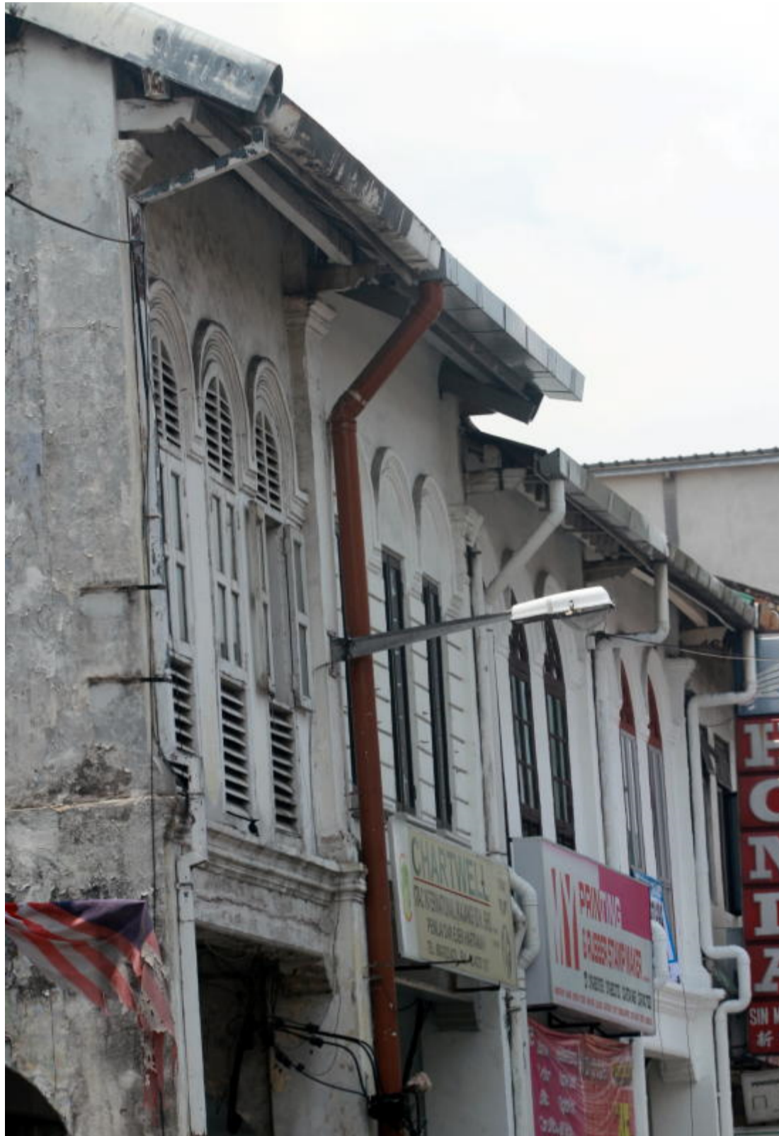
Kajang terkenal dengan binaan bangunan-bangunan lama.

"Pada 1999, saya cadangkan kepada Persekutuan Persatuan Tionghua Kajang untuk menubuhkan pusat warisan ini dan cadangan itu dipersetujui dan kekal hingga ke hari ini," katanya yang mula menjadi pendidik pada 1986.