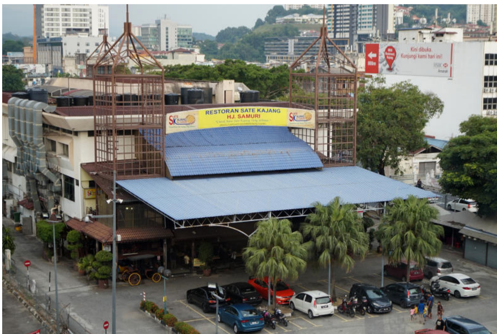
Kajang juga terkenal dengan Sate Hj Samuri.

Salah sebuah kedai klasik itu, diwarisi generasi kedua keluarga Siew Poh Chang, 88 tahun yang menjual lebih 400 jenis biskut yang diimport dari Thailand dan kilang biskut seluruh negara.