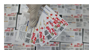
Sijil vaksinasi guna teknologi 'blockchain' tidak boleh dipalsukan