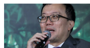
Ekonomi Malaysia dijangka capai pertumbuhan KDNK 6.2 peratus