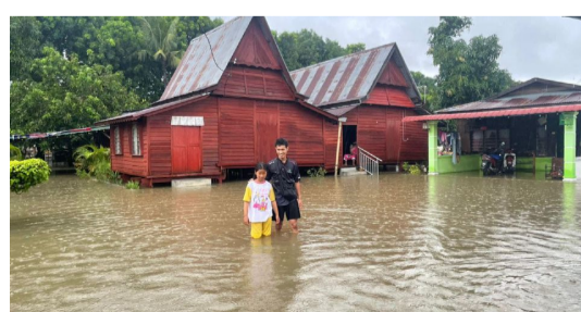
MUTAKHIR 3 PPS dibuka di Melaka