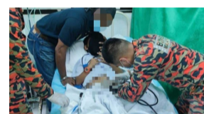
Tahan sakit kemaluan tersepit pada zip seluar