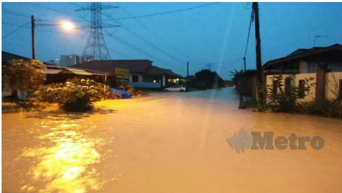
ANTARA rumah penduduk yang terjejas akibat banjir kilat.

Menceritakan kejadian itu, Mohd Zaidi berkata, dia tidak pulang ke kampung di Terengganu berikutan isterinya sedang sarat dan menunggu hari untuk melahirkan anak keempatnya.