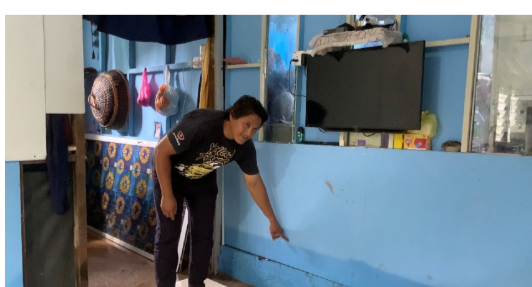
MUTAKHIR Limpahan air Sungai Perak: Penduduk 'penat' bersih rumah