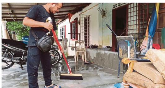
MUTAKHIR 'Tiada apa lagi nak dibuang'