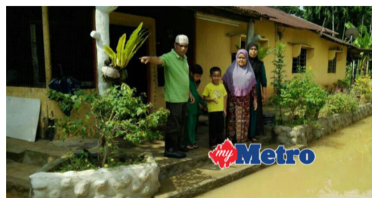
MUTAKHIR 'Kali ni sampai masuk rumah'