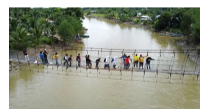
Jambatan gantung usang sudah dibaiki